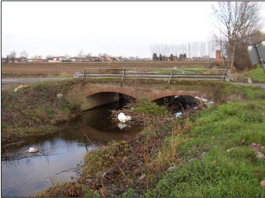
PONTE BARIPO005 (da: BUGNPO002 – foto 024)