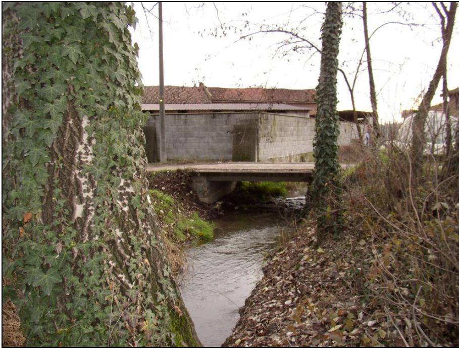
ATTRAVERSAMENTO BARIAG009 (da: BUGNA007 – foto 021)