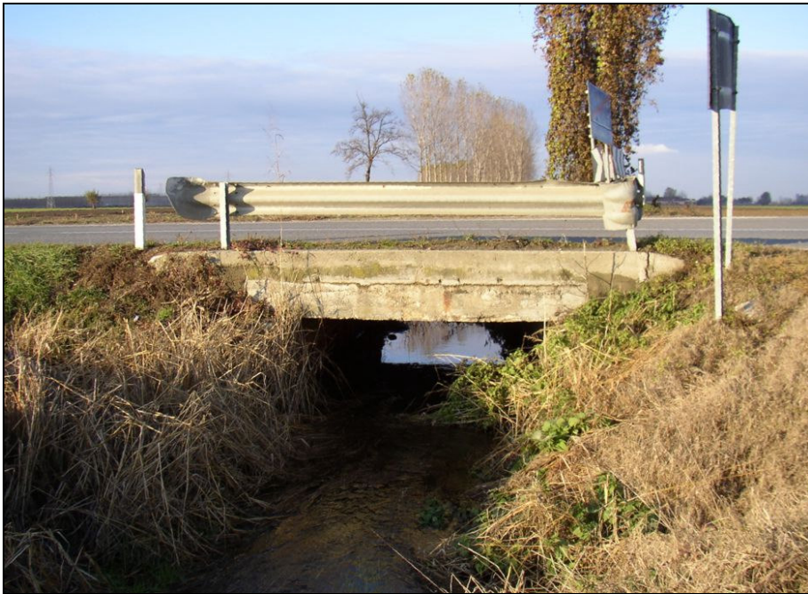
ATTRAVERSAMENTO BARIAG010 (da: BUGNAG011 – foto 026)