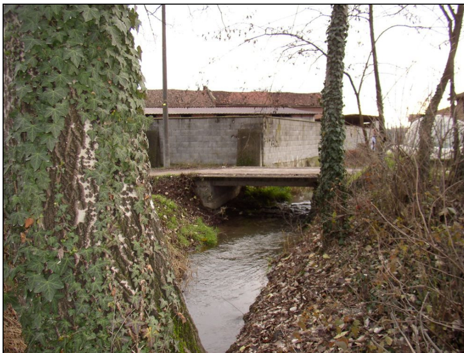
ATTRAVERSAMENTO BARIAG009 (da: BUGNA007 – foto 021)