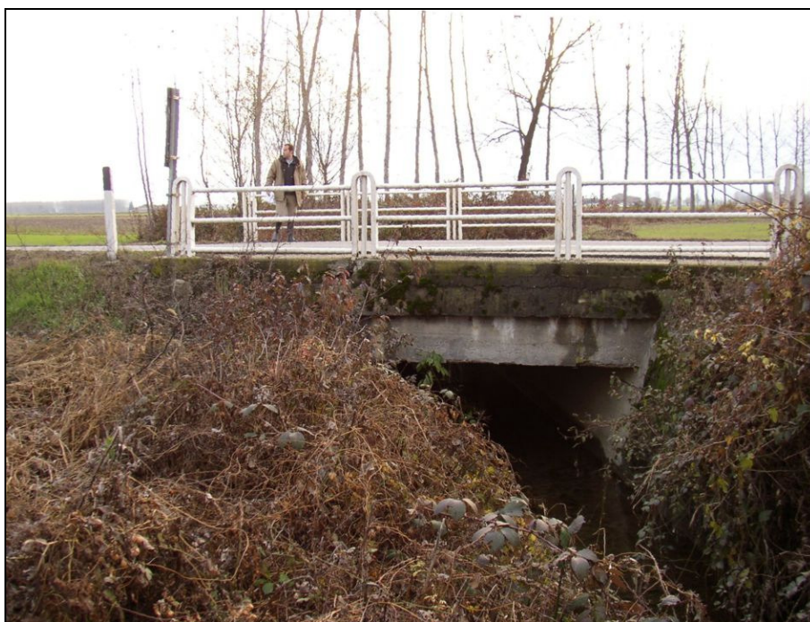
ATTRAVERSAMENTO BARIAG005 (da: BUGNA005 – foto 028)