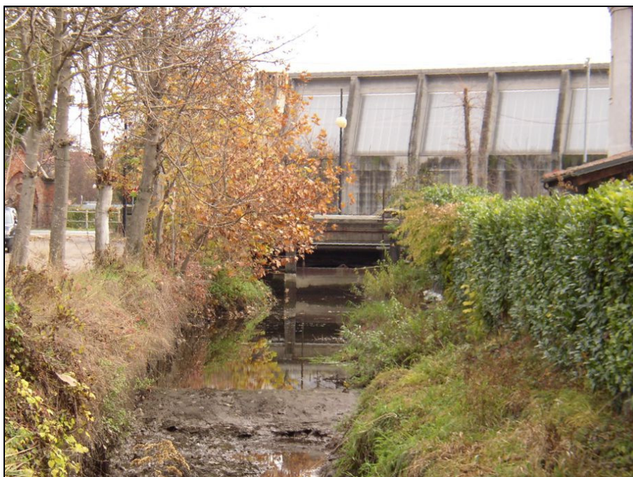
ATTRAVERSAMENTO BARIAG002 (da: BUGNAG014 – foto 011)