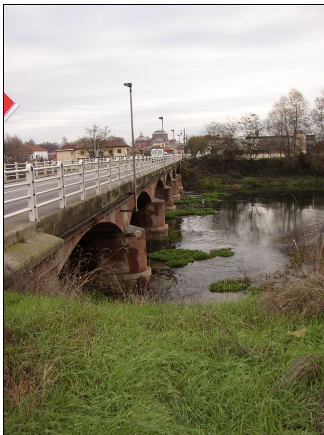
PONTE BARIPO001 (da: BUGNPO001 – foto 020)