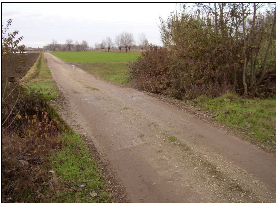
ATTRAVERSAMENTO BARIAG004 (da: BUGNAG018 – foto 023)