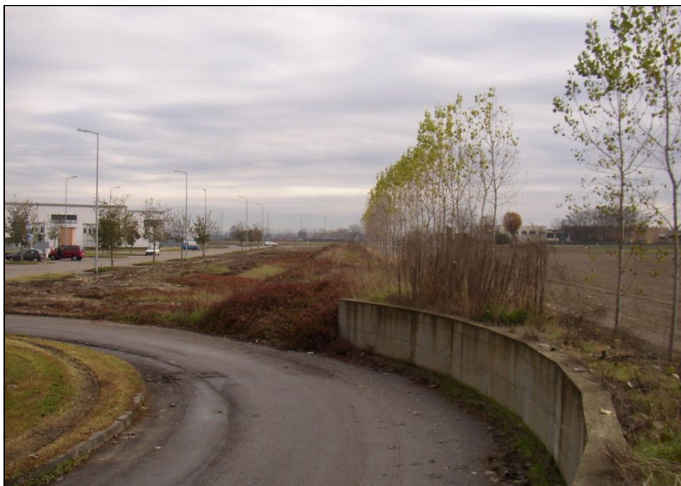
ARGINE BARIAR017 (da: BUGNAR010 – foto 002)