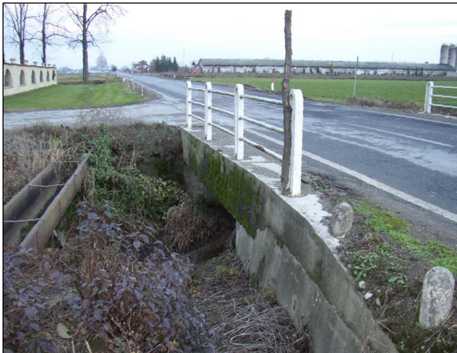
ATTRAVERSAMENTO BARIAG001 (da: BUGNAG001 – foto 032)