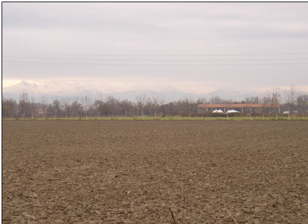
ARGINE BARIAR016 (da: BUGNAR001 – foto 008)