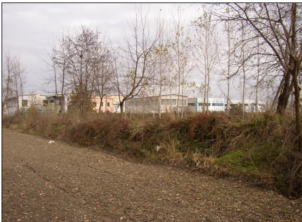
ARGINE BARIAR017 (da: BUGNAR010 – foto 006)