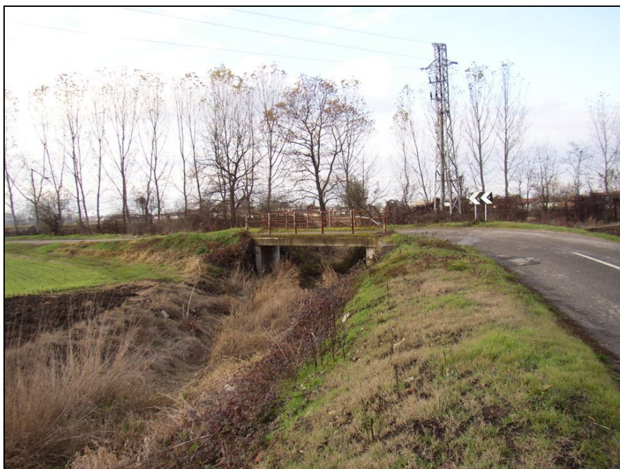
PONTE BARIPO006 (da: BUGNPO003 – foto 025)