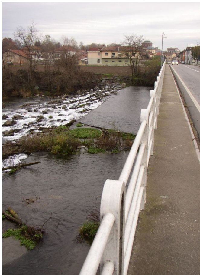
SOGLIA BARISO002 (da: BUGNSO001 – foto 019)