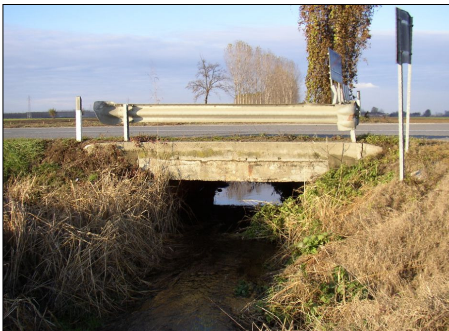
ATTRAVERSAMENTO BARIAG010 (da: BUGNAG011 – foto 026)