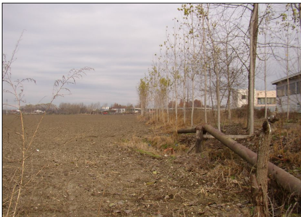
ARGINE BARIAR017 (da: BUGNAR010 – foto 007)