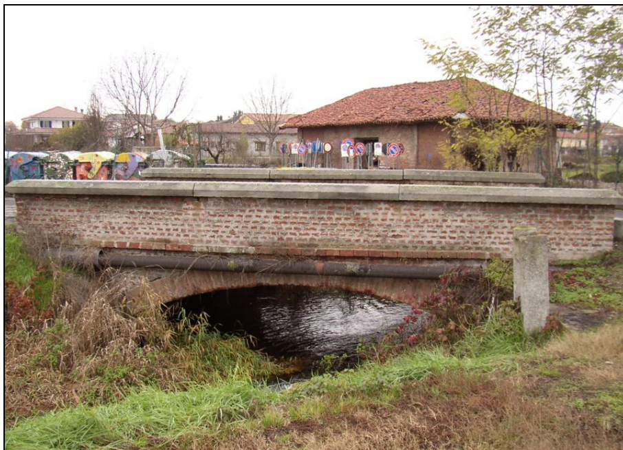
PONTE BARIPO003 (da: BUGNAG016 – foto 016)