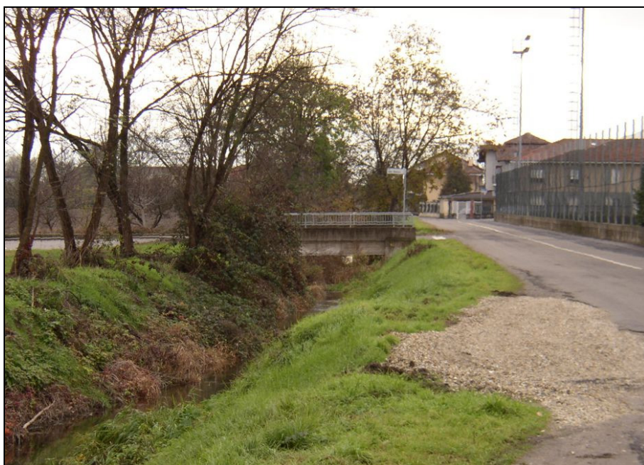
PONTE BARIPO004 (da: BUGNAG017 – foto 017)