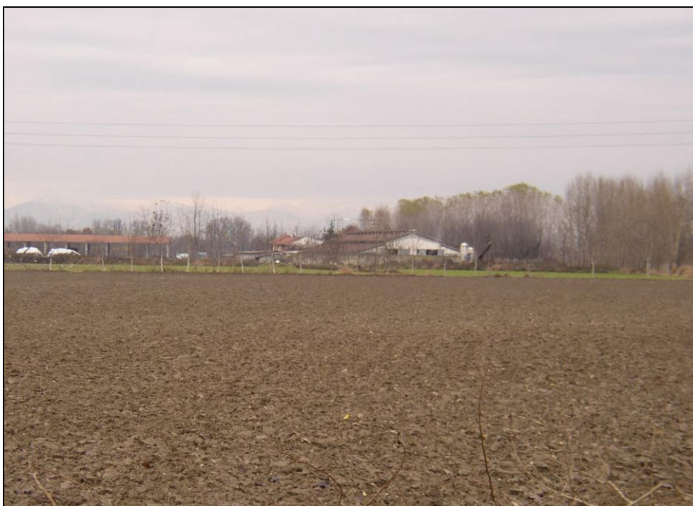
ARGINE BARIAR016 (da: BUGNAR001 – foto 009)