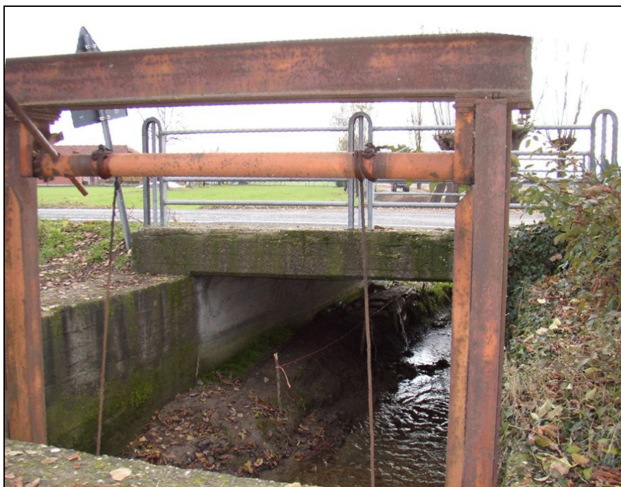
ATTRAVERSAMENTO BARIAG006 (da: BUGNAG003 – foto 030)