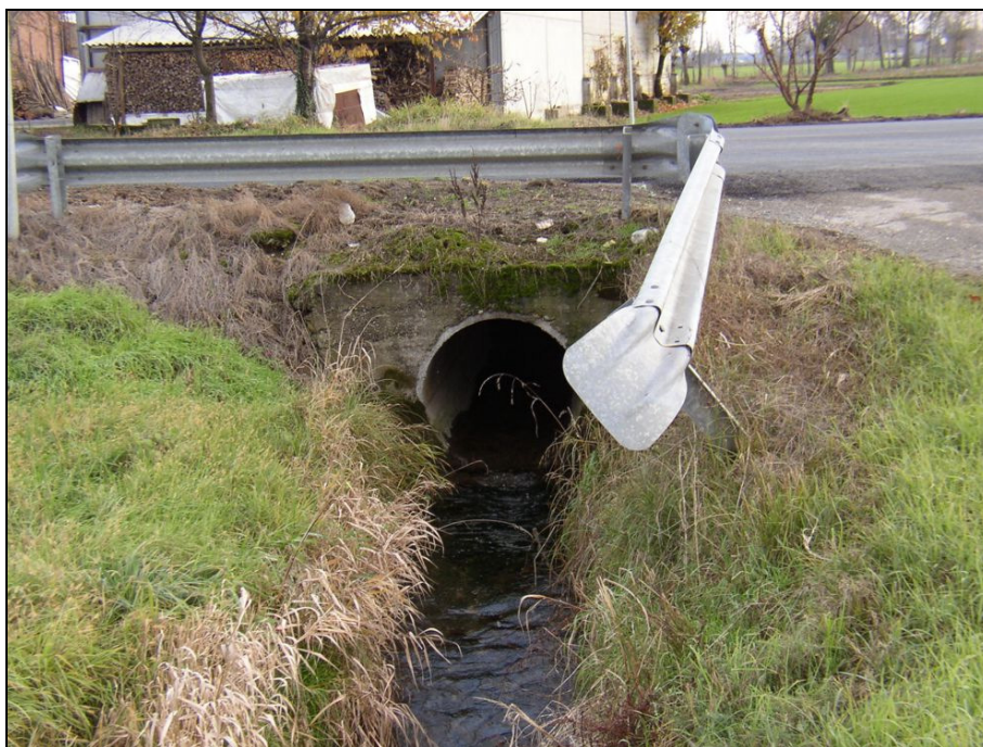
ATTRAVERSAMENTO BARIAG007 (da: BUGNA004 – foto 029)