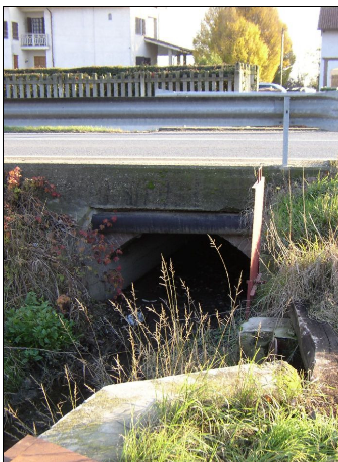
ATTRAVERSAMENTO BARIAG008 (da: BUGNAG009 – foto 027)