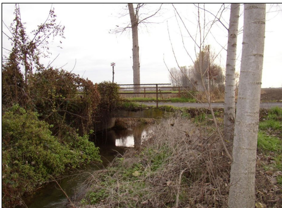
ATTRAVERSAMENTO BARIAG003 (da: BUGNA006 – foto 022)