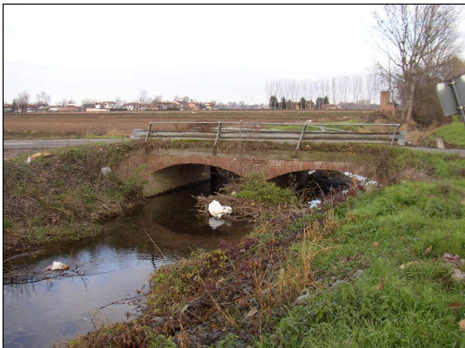
PONTE BARIPO005 (da: BUGNPO002 – foto 024)