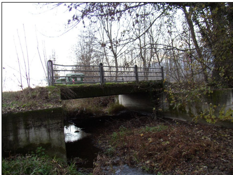
PONTE BARIPO002 (da: BUGNAG002 – foto 031)